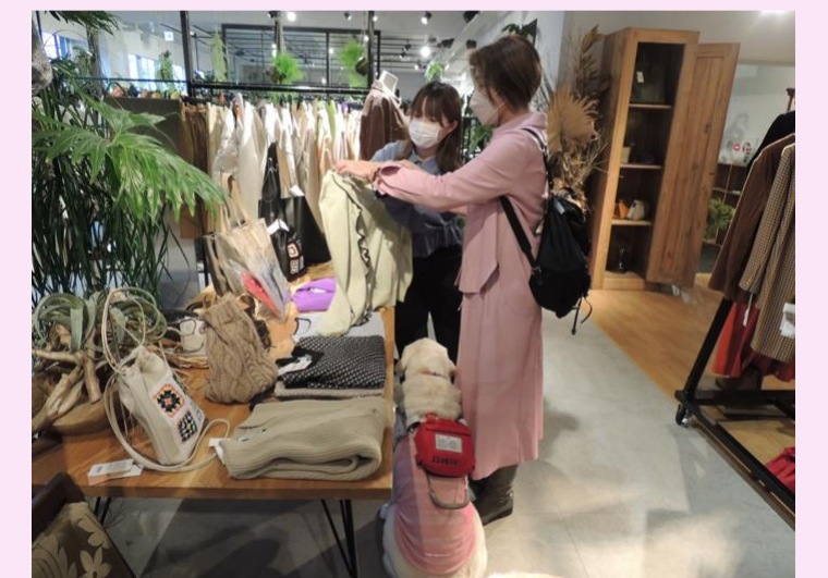
従業員が障害当事者として障害者に対する接客でのポイントをスタッフに助言できることの効果は大きい。

視覚障害者にとって「服選び」は困っていることのひとつです。自分の好みを伝えたり、予算に応じて選ぶことも難しいんです。そのことをスタッフさんにお話しして、どんな説明が必要かを理解していただきました。色や形、素材などを具体的に伝えていただいています。